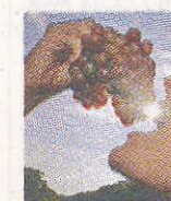
L'UVA Che voglia!

Via alla festa dell'uva, a Cornuda. Fino a domenica 11 settembre nel magazzino comunale 5 stand gastronomici con prodotti tipici e artigianato locale. Stasera dalle 19 «Spritz Time» e alle 21 cena ufficiale del gemellaggio con la «Schola Cantorum Sar Martino» e il coro «Singgemein schaft» di Natsbach (Austria).