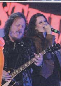
A sinistra la conduttrice Matilde Brandi. Sopra in piccolo alcuni ospiti big: da sinistra Zuccherò con Irene Fornaciari e Lucio Dalla