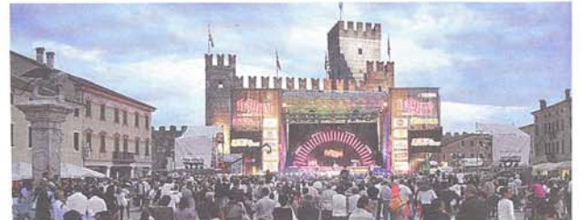
Piazza degli Scacchi di Marostica si sta riempiendo: il decimo Festival Show accende i motori.