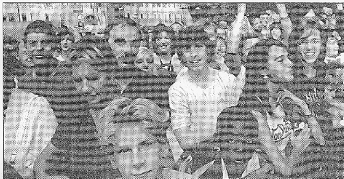
Il pubblico presente in piazzale Burchiellati. Sopra Paola e Chiara durante il concerto