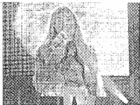
Elenoire Casalegno sarà l'attrice anche stasera a Bizzano

Quarantasette a Sanremo in gara con "La perdolina", reg-